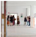
LA SINGULARIDAD PLURAL