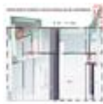
HIPERESPEJO SONORO CON ECO MODULAR EN LONTANANZA