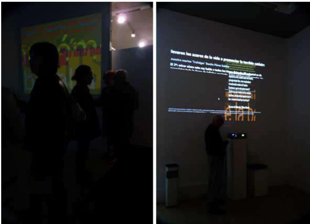
Exposición en Ra de Rey

Galería Ra del Rey, Madrid, España; 2010.