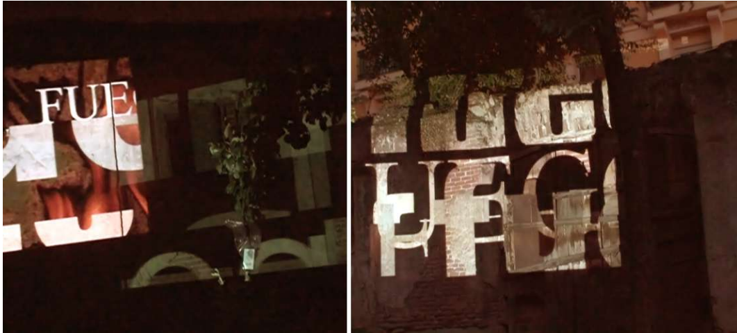
Las palabras de fuego en Esto es una plaza .

En el espacio público Esto es una plaza , en el barrio de Lavapiés, Madrid, España; durante la noche de San Juan se proyectaron estos dos scripts sobre paredes y personas, haciendo girar las plataformas y reflejando las proyecciones con los espejos, Todo el espacio de la plaza, incluido edificios, quedaba inundado por las imágenes.