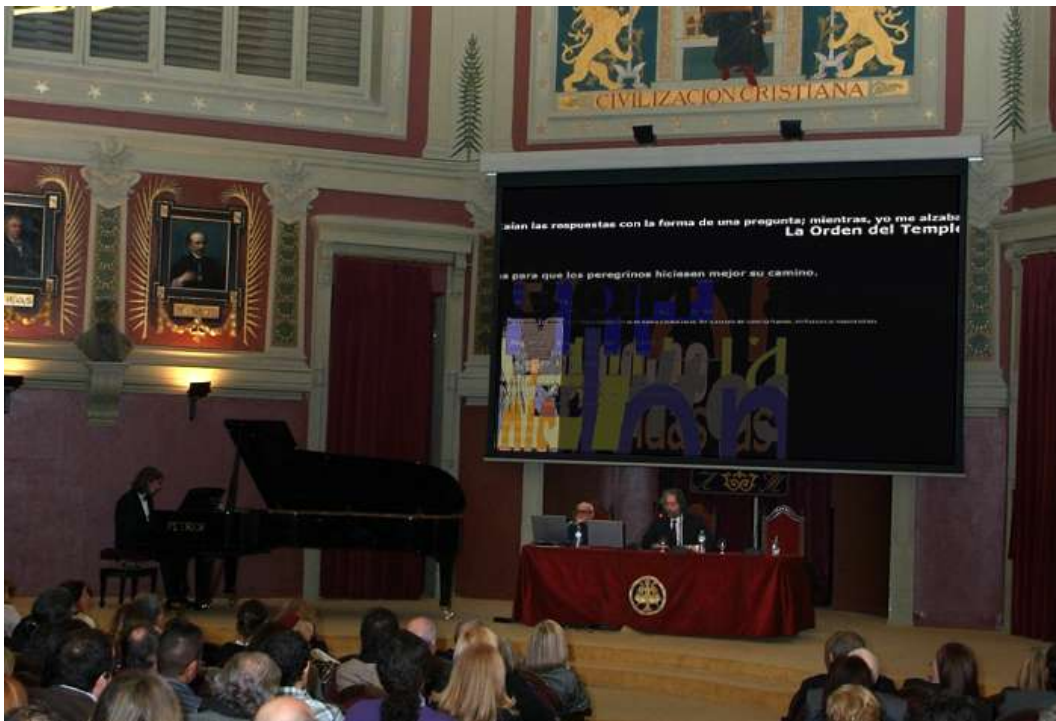
Recital en el Ateneo de Madrid.

Ha sido presentado en: Ateneo de Madrid, España; 2011.