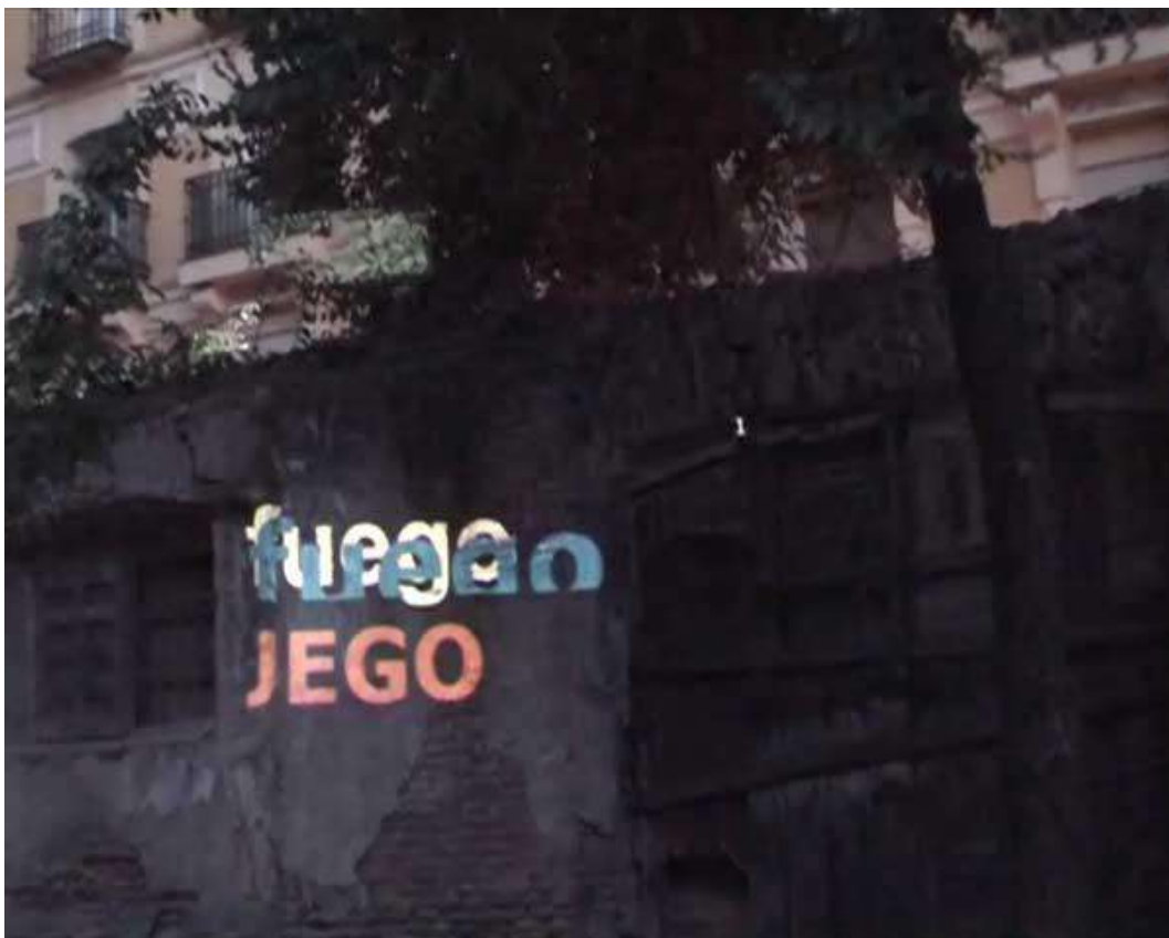
Las palabras de fuego en Esto es una plaza.

Esto es una plaza, Madrid, España; 2011.