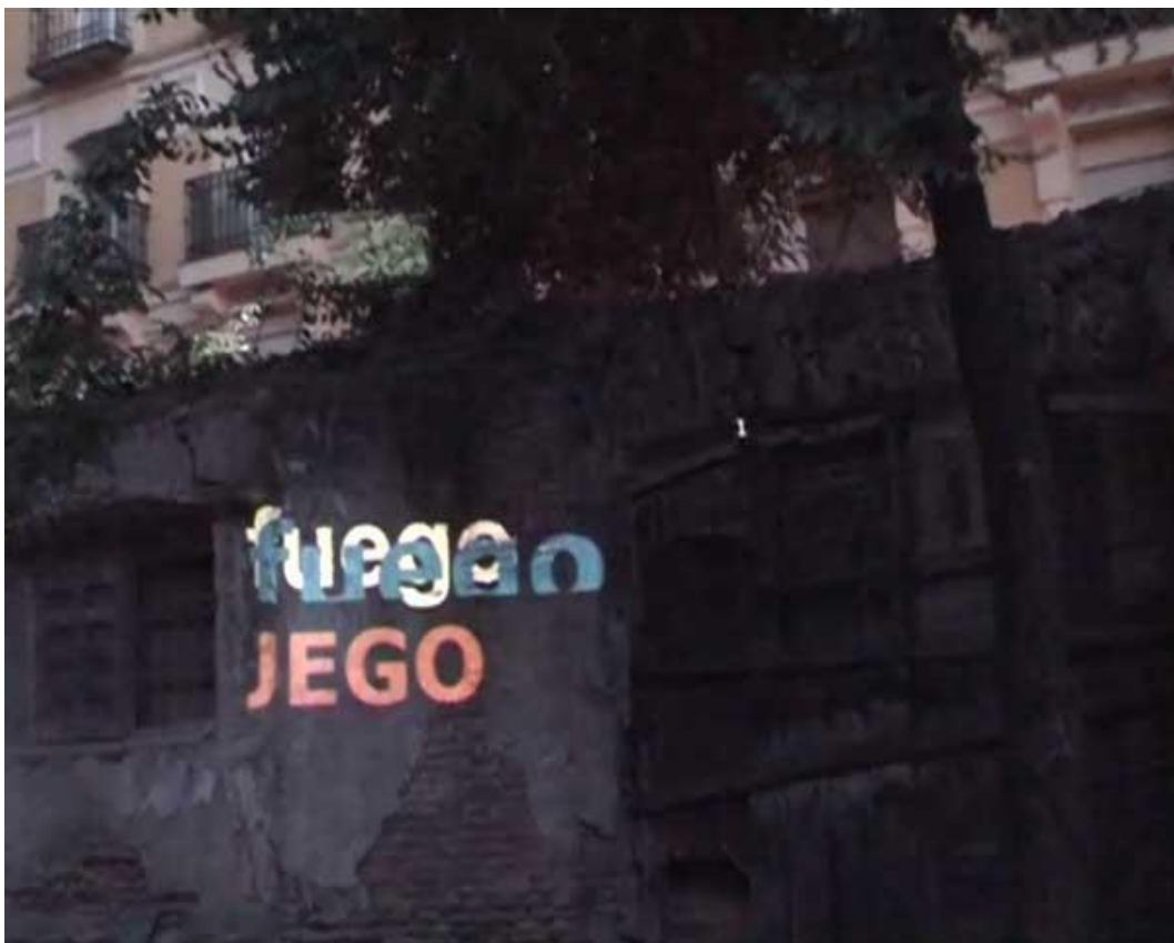
Las palabras de fuego en Esto es una plaza.

Esto es una plaza, Madrid, España; 2011.