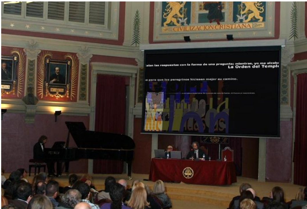
Recital en el Ateneo de Madrid.

Ha sido presentado en: Ateneo de Madrid, España; 2011.