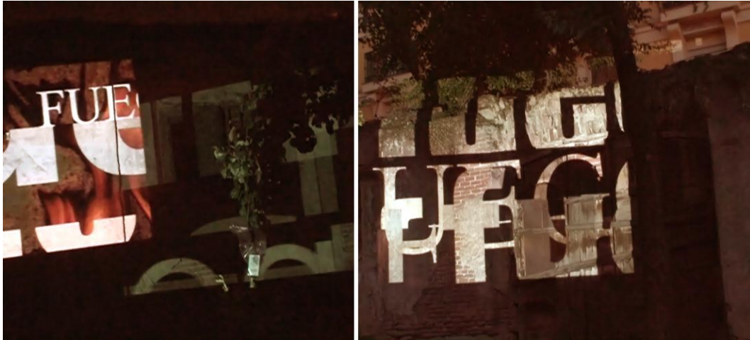
Las palabras de fuego en Esto es una plaza.

En el espacio público Esto es una plaza , en el barrio de Lavapiés, Madrid, España; durante la noche de San Juan se proyectaron estos dos scripts sobre paredes y personas, haciendo girar las plataformas y reflejando las proyecciones con los espejos, Todo el espacio de la plaza, incluido edificios, quedaba inundado por las imágenes.