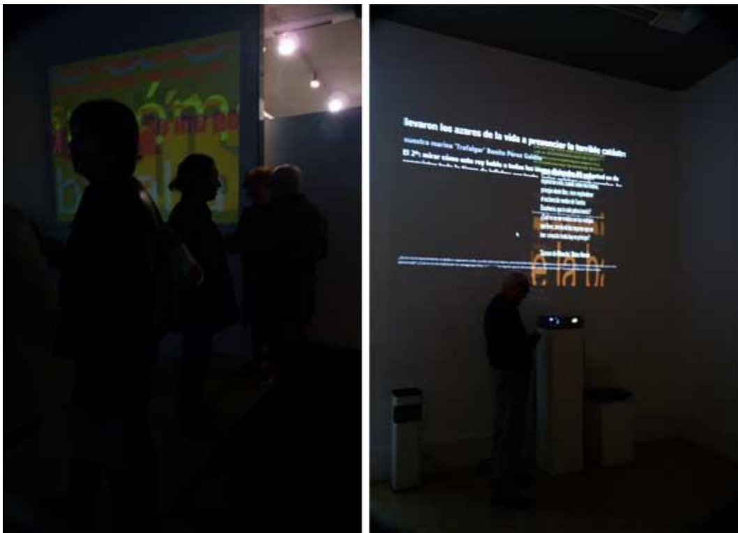
Exposición en Ra de Rey

Galería Ra del Rey, Madrid, España; 2010.