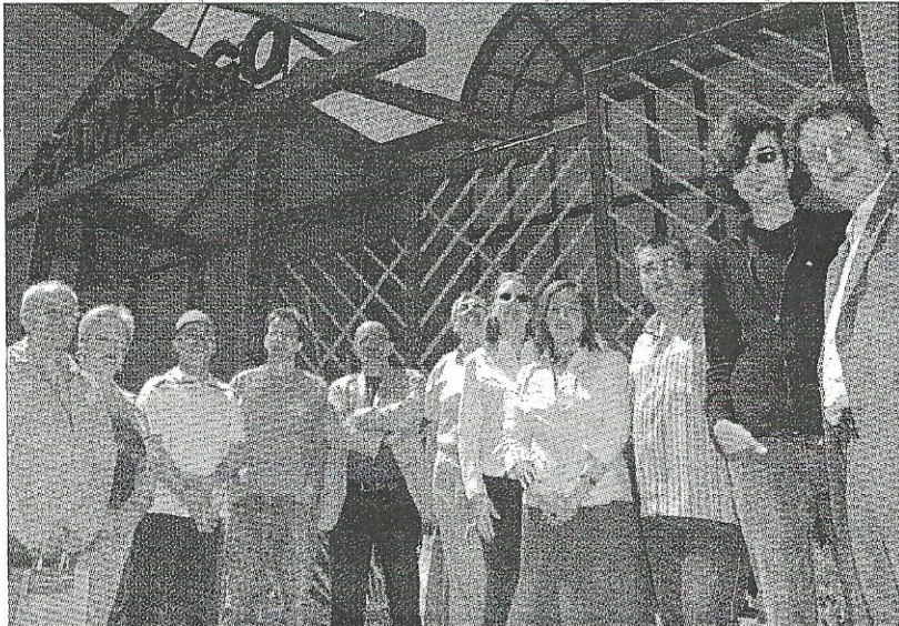
Artistas invitados junto con los organizadores del Festival.