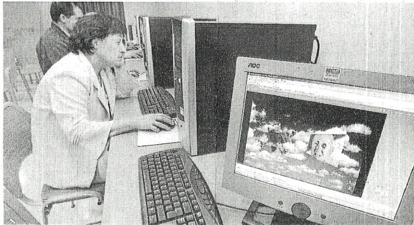
'Camargo Cibernético' celebra hace dos años su primera edición.

La constante revisión de la obra de arte electrónica es precisamente el ámbito de la ponencia que deberán desarrollar los participantes. Camargo Cibernético Versión 2.1 está comisariado y dirigido por Antonio Alvarado, quien subraya que esta convoca-