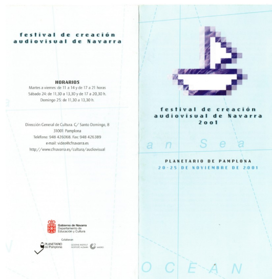
Folleto del Festival