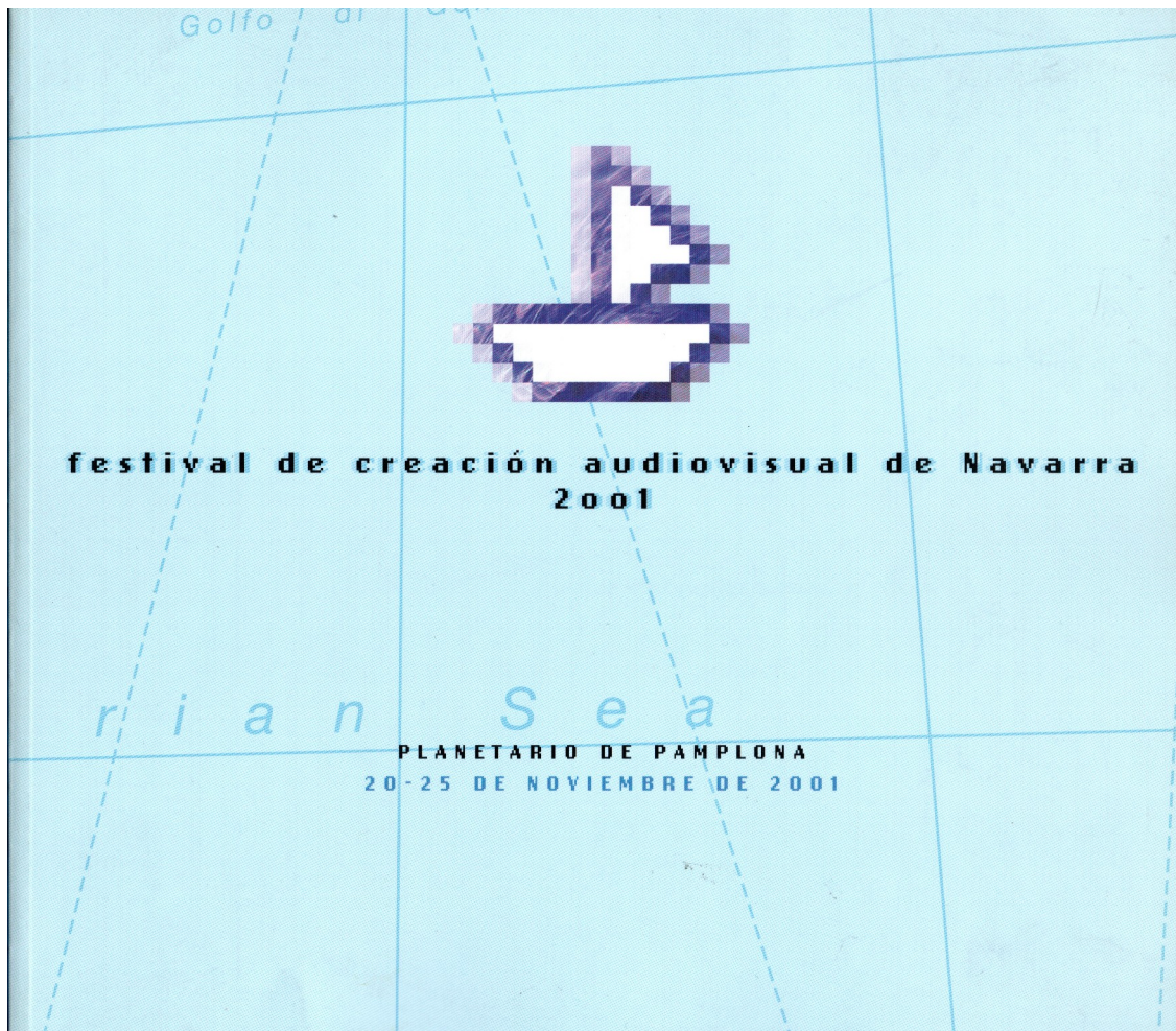
Catálogo del Festival.