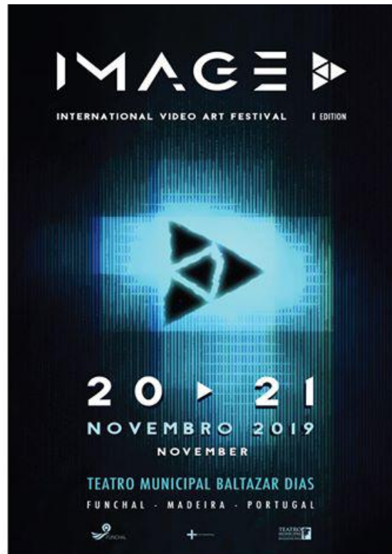
IMAGE PLAY - International Video Art Festival, is supported by the Department of Economy and Culture of the Municipal Chamber of Funchal and diffusion by the organization + Art Contemporary.