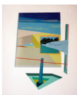
Arquitectura Primigenia original en 1981.

Trata sobre la arquitectura del espíritu del hombre como género.